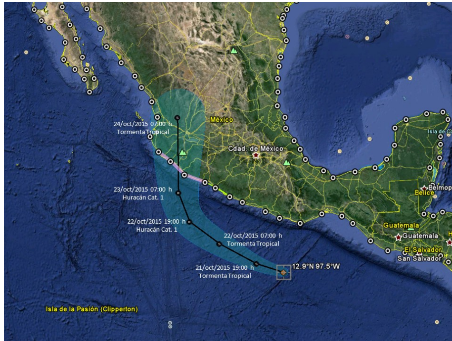
Trayectoria pronóstico de la Tormenta Tropical "PATRICIA"